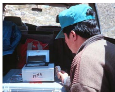
PIMA del PMA trabajando en Bolivia - Nov 1999