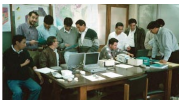
Entrenamiento del PIMA en SERGEOMIN, Bolivia - Nov 1999